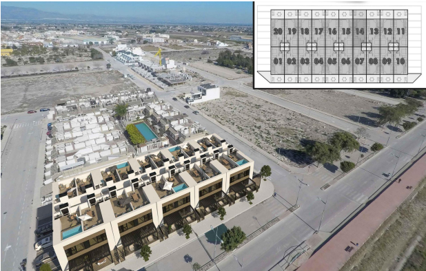
Type: 2 Bedrooms