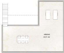
P1 / FIRST FL.