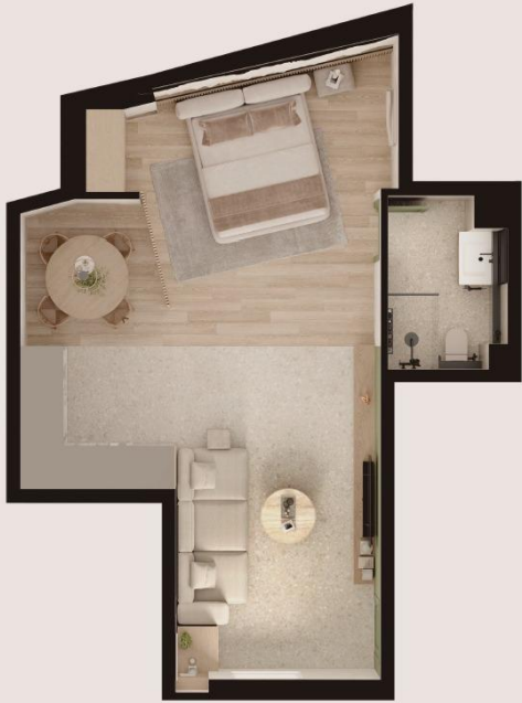
Studio -2 S=47,8m2